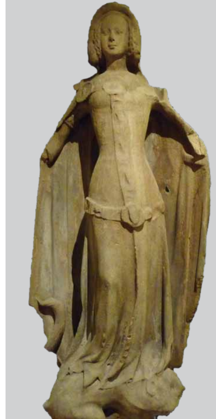
Katharina von Böhmen, um 1360, Wienmuseum