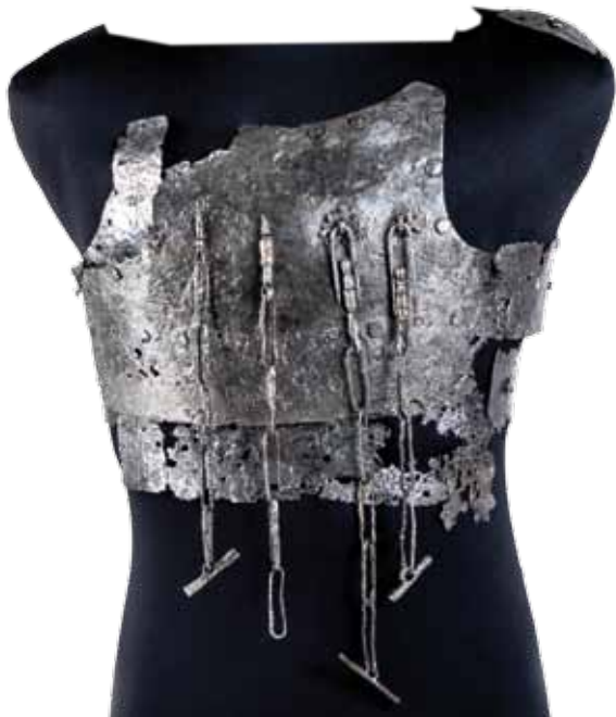
oben: Plattenrock, um 1350 © Bayerisches Armeemuseum (Foto: Gert Schmidbauer) Titelfotos: Hans Prunner Editore

Rüstung und Kleidung dienten neben ihrer rein praktischen Bestimmung auch dem Sozialprestige des Trägers, dementsprechend aufwendig wurden sie gestaltet. In der Tagung werden neue Forschungsansätze präsentiert, die sich sowohl mit ganz praktischen als auch prachtvollen Objekten beschäftigen. Dabei wird deutlich, dass die Grenzen zwischen Rüstung und Kleidung oft fließend sind.