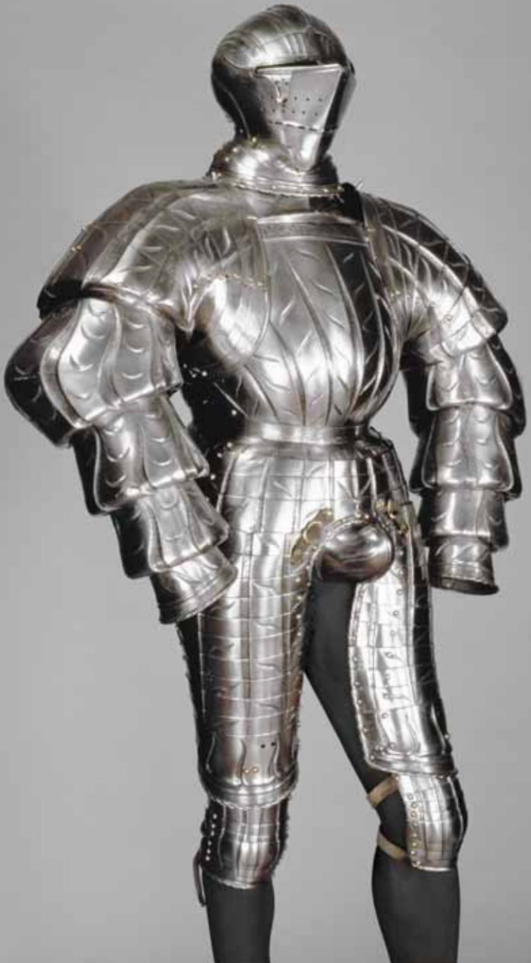
Der Landsknecht-harnisch des Wilhelm von Rogendorf, 1523